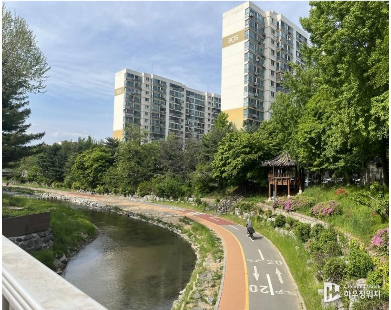
과천 양재천변 산책로/자전거길에서 바라본 8,9 단지 전경