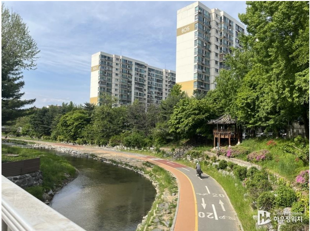
과천 양재천변 산책로/자전거길에서 바라본 8,9 단지 전경