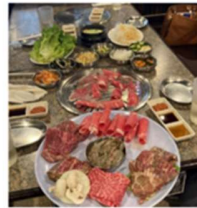
(당일 해물파전 원장찌개 추가, 새우는 불포함)