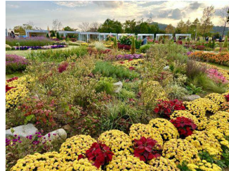
2023 년 10 월 27 일 순천 (김동희 동문 공대 66)