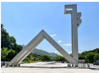
2023 년 5 월 모교 방문 (홍청일 동문 약대 57)

동아리모임: 음악 이영우(문리대 66), 댄스 황찬주(인문대 84), 독서 박종희(의대 69), 수영 김동엽 (사대 86), 고문: 역대회장, 특별고문: 황치룡 (문리대 65), Golden Club 회장: 한경진 (상대 59), 관악 Club 회장: 김동엽 (사대 86), 장학금 관리위원회: 위원장 한의일(공대 62), IRS Task Force: 장윤일(공대 60), 한경진(상대 59), 한재은(의대 59)