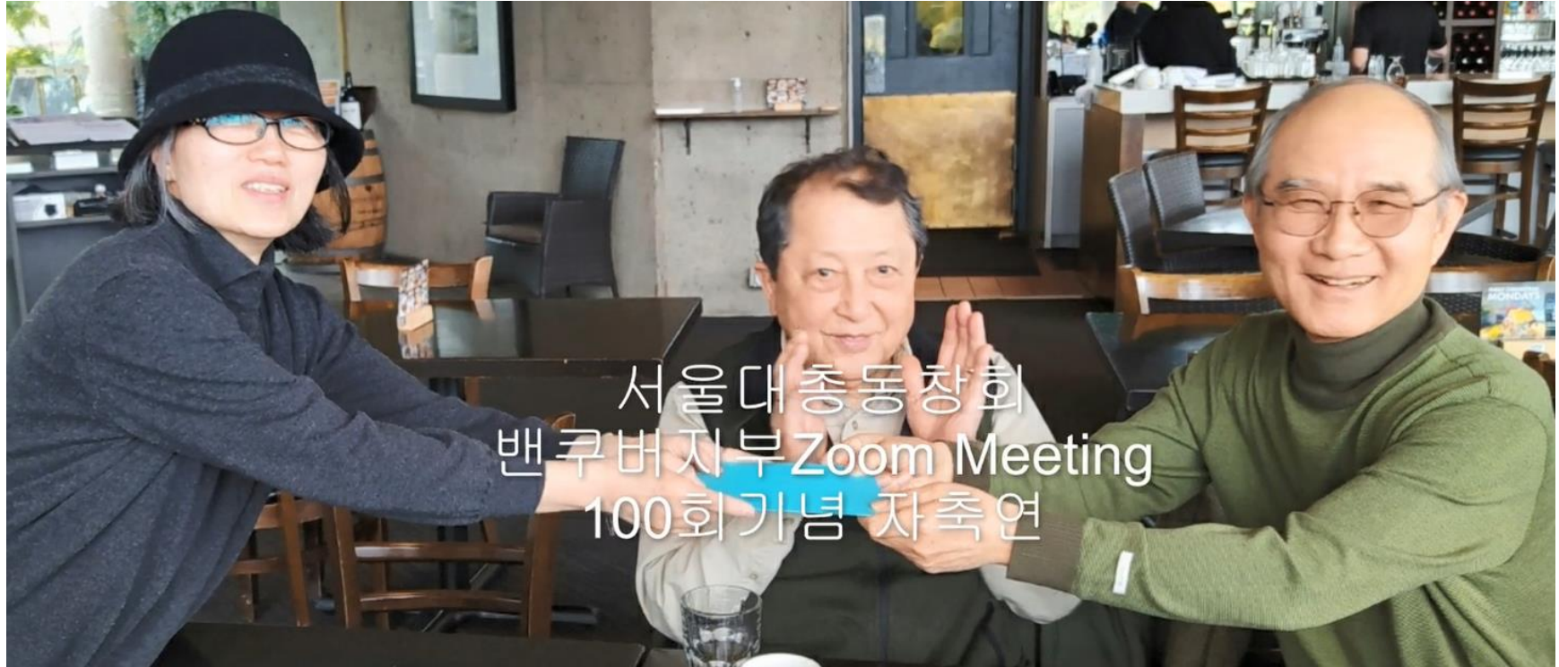
서울대총동창회 밴쿠버지부 Zoom Meeting 100회기념 자축연